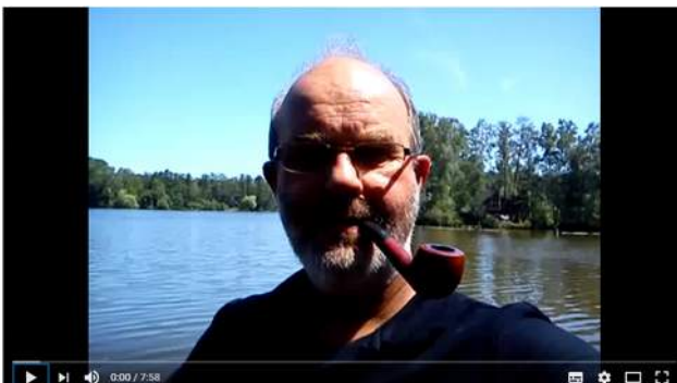
Pfeife rauchen: Häufig gestellte Fragen (1) - u. a. "Was muss ich als Anfänger beachten?"