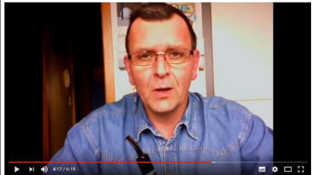
Pfeife rauchen für Beginner Teil 4