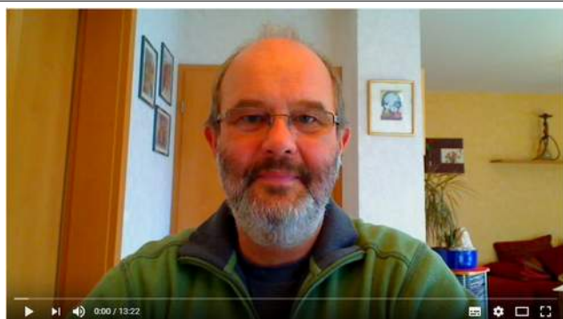
Allgemeines Pfeifenwissen, Teil 3: Klassische Pfeifenformen (Shapes)