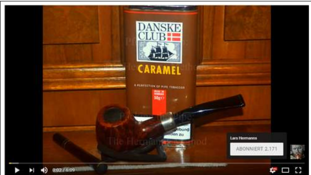
Pfeife stopfen: Die Hermanns Methode | Packing the Pipe: The Hermanns Method