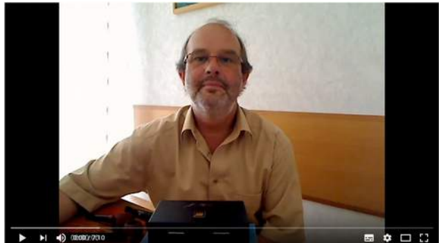
Pfeife rauchen: 3 Methoden um Pfeifen richtig zu stopfen