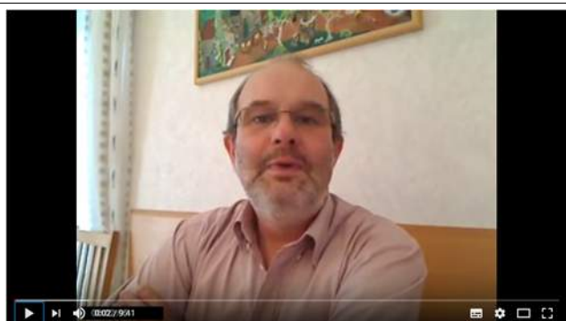
Pfeifen richtig reinigen