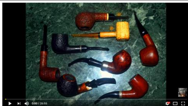
Pfeiferauchen für Anfänger: Die Wahl der Pfeife | Pipe Smoking for Beginners: The first pipe