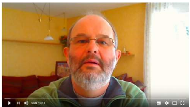
Ratgeber Pfeife: Qualitätsmerkmale einer guten Pfeife