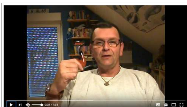
Wie preiswert klappt der Pfeifeneinstieg? TEIL 1