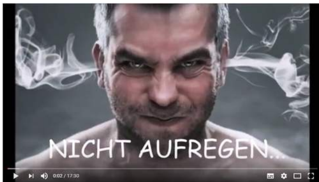
PFEIFENFRAGEN : Stopfen, zünden, rauchen - kompakt