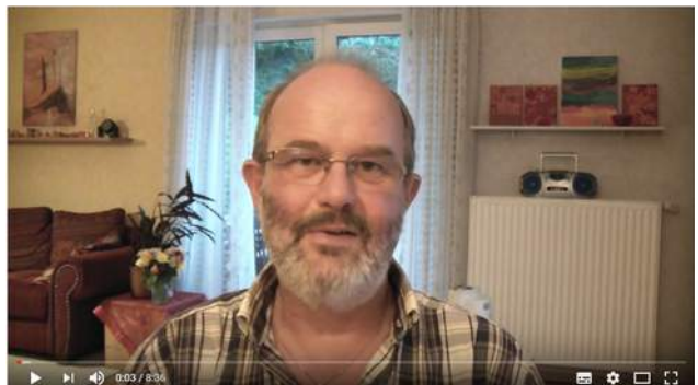
Pfeife rauchen: Häufig gestellte Fragen (2) - u. a.: "Ist Pfeiferauchen schädlich?"