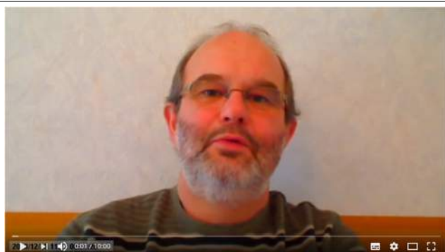
Ratgeber Pfeife: Die Wahl der geeigneten Tabakspfeife