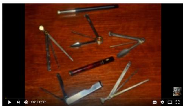
Der Stopfer... und wie er funktioniert | The Tamper... and how to use it | Pfeife rauchen