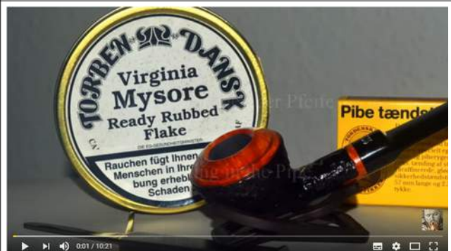
Das Pfeife Einrauchen | Breaking in the Pipe | Pfeife rauchen