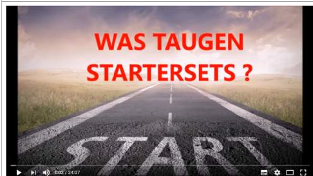
PFEIFENFRAGEN : Was taugen Startersets ?