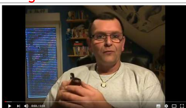
Wie preiswert klappt der Pfeifeneinstieg TEIL2