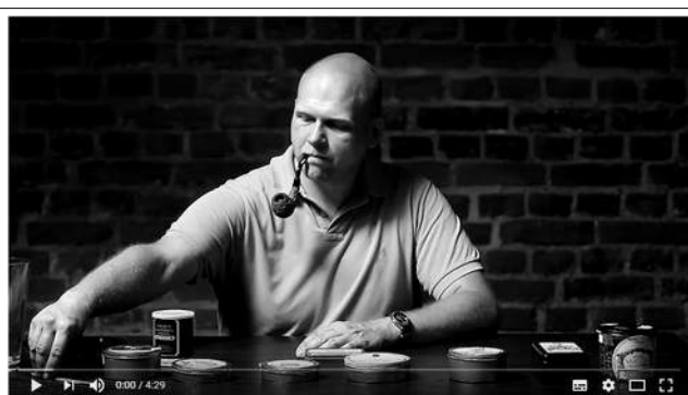
Tabakaromen für Anfänger