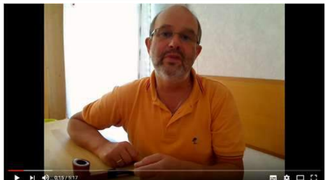
Pfeifen richtig pflegen: Lockeres Mundstück neu anpassen