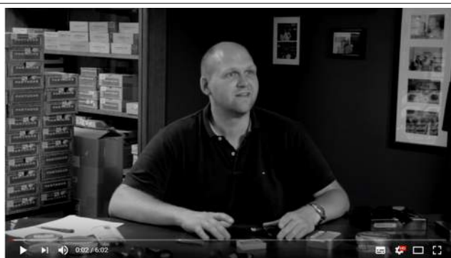
Die erste Pfeife rauchen