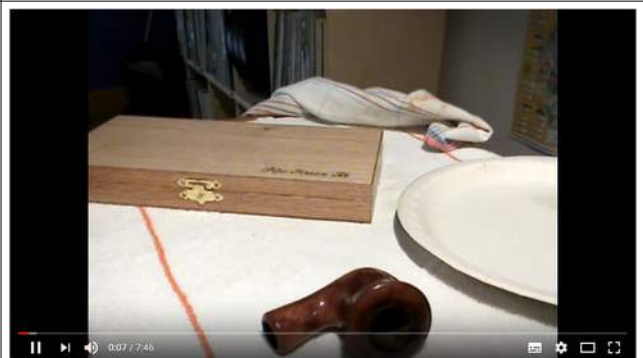
Pfeifenkopf räumen Teil 1