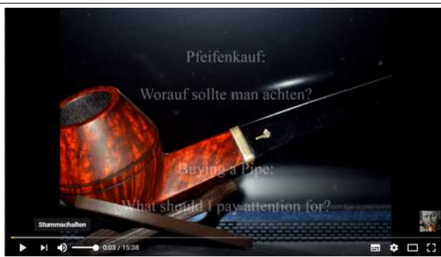
Pfeifenkauf: Worauf sollte man achten? | Buying a Pipe: What should I pay attention to?