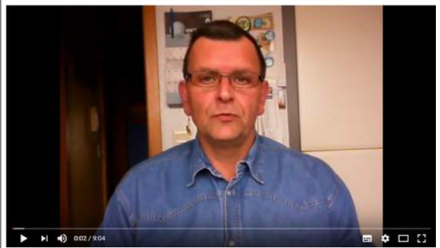
Pfeife rauchen für Beginner Teil 2