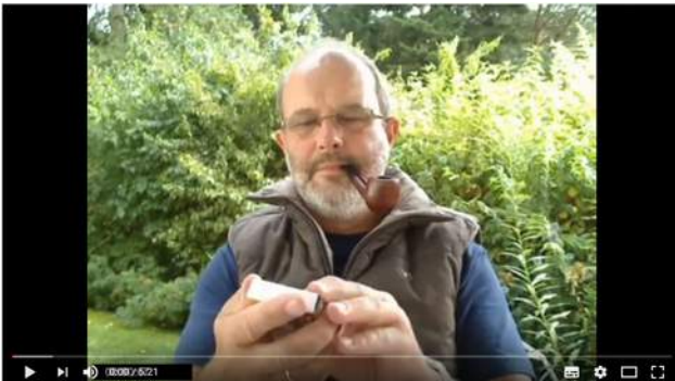
Pfeifen richtig pflegen: Körpereigene Pflegemittel