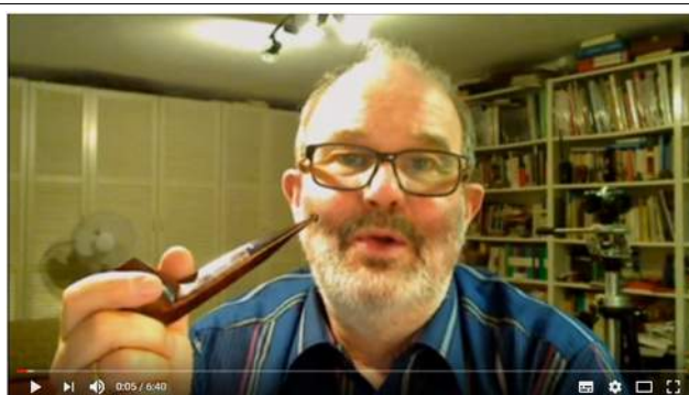
Perfektes Pfeiferauchen ohne Zungenbrand