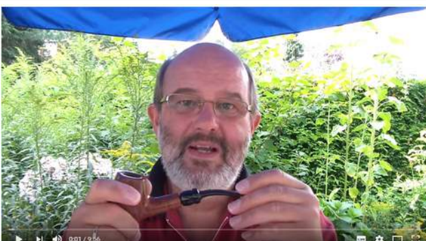
Pfeife rauchen: Häufig gestellte Fragen (3) - u. a.: "Tabak: Gift oder Genuss?"