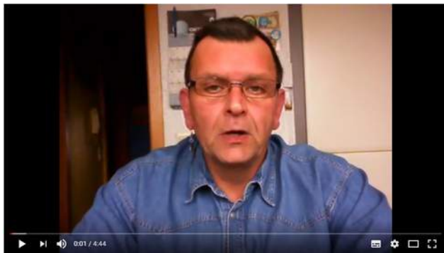
Pfeife rauchen für Beginner Teil 3