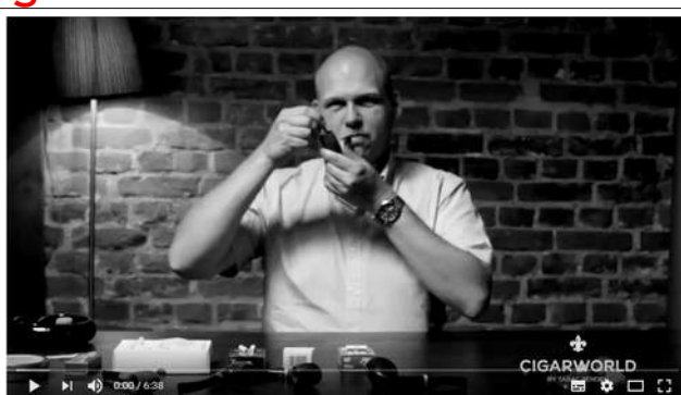
Pfeifenwissen für Anfänger Mundstücke und Filter