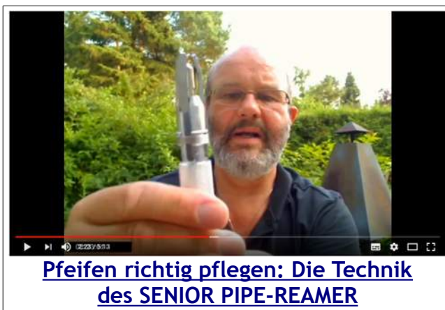
Pfeifen richtig pflegen: Die Technik des SENIOR PIPE-REAMER