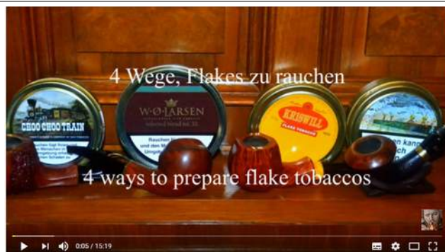
Vier Wege, Flakes zu rauchen | Four ways to smoke flake tobaccos | Pfeife rauchen