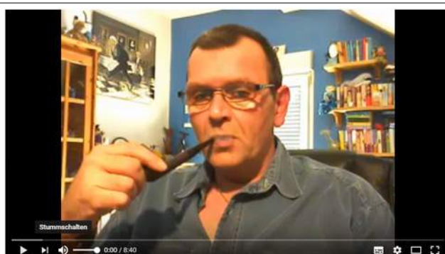
FÜR BEGINNER 1