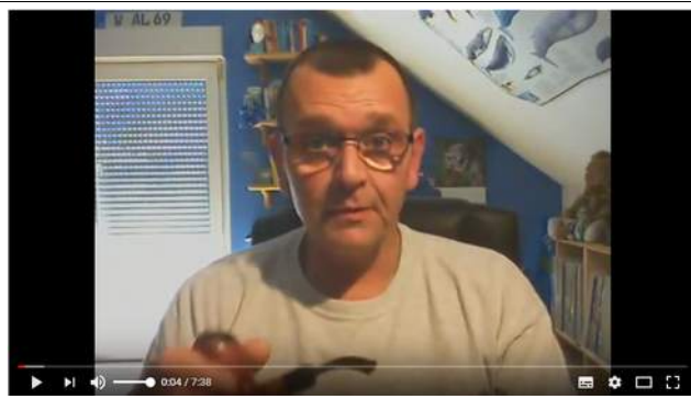
Pfeifenkopf räumen Teil 2