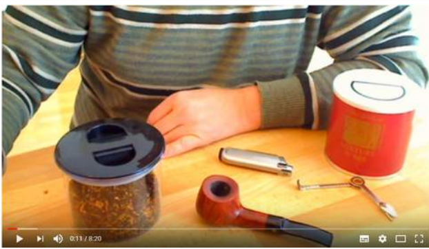
Ratgeber Pfeife: Die Pfeife richtig stopfen und rauchen