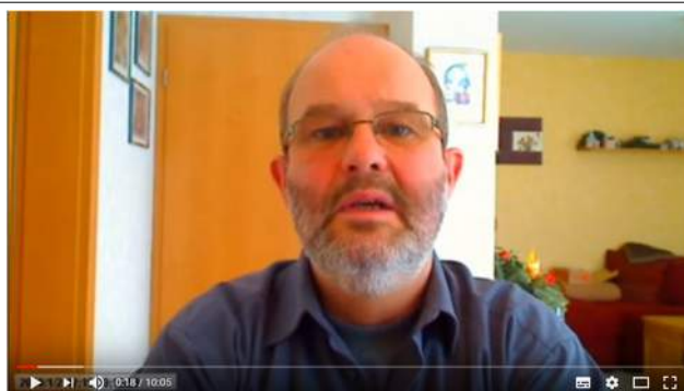
Ratgeber Pfeife: Kleine Tabakkunde und Tipps zum richtigen Kauf