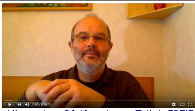
Allgemeines Pfeifenwissen, Teil 4: FREIE PFEIFENFORMEN (SHAPES)