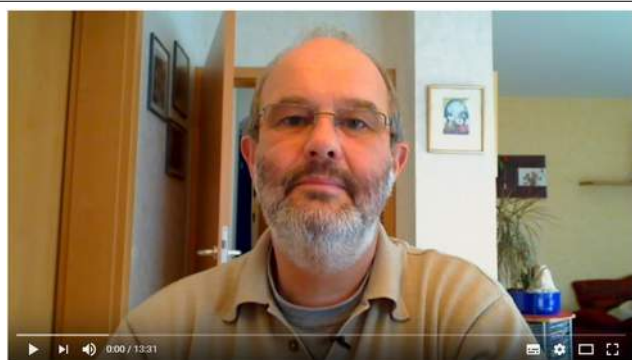
Allgemeines Pfeifenwissen, Teil 1: Materialien für den Pfeifenbau