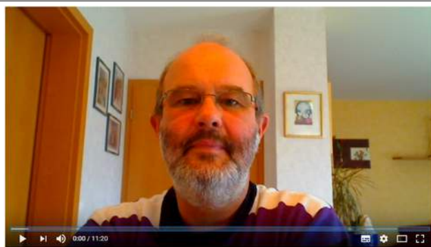
Allgemeines Pfeifenwissen, Teil 2: Pfeifenoberflächen (Finishes)