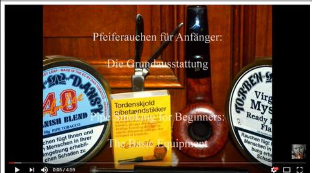
Pfeiferauchen für Anfänger: Die Grundausstattung | Pipe Smoking for Beginners: The Basic Equipment