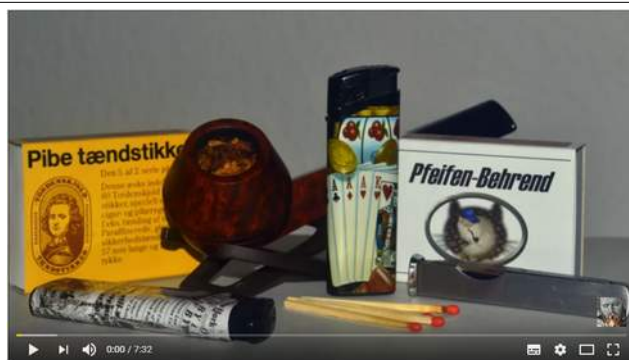
Wie man die Pfeife anzündet | How to light the Pipe | Pfeife rauchen