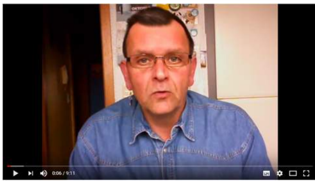
Pfeife rauchen für Beginner Teil 1